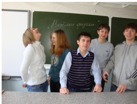
Самые веселые физики